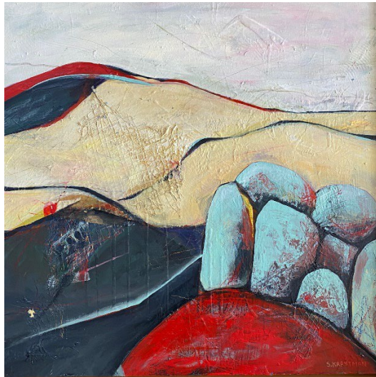
Free to Be , Sonja Krastman, acrílico sobre panel de madera, 2022